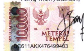
Muhammad ibdaai izzatul islam